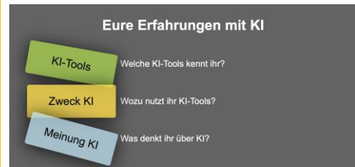
Abbildung 3 Beispielumfrage erstellt mit Oncoo

Tipp: Als deutschsprachiges Online-Umfrage-Tool können Sie z.B. Oncoo nutzen ( www.oncoo.de ).